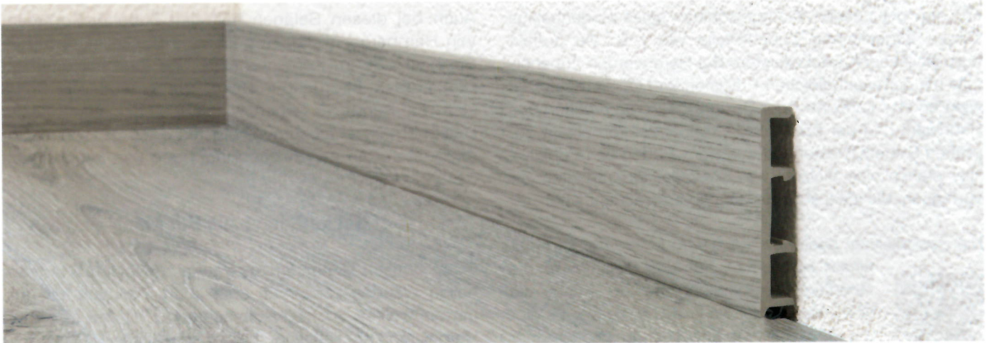
Die Aquilex 7000-Leiste von Direct Handling aus geschäumtem Kunststoff ist wasserfest und pflegeleicht.

Mit dem neuen Aquilex 7000 vereinfacht Direct Handling die Sockel-Montage und gibt seinen Kunststoffsockeln eine moderne, kubische Optik. Die Aquilex-Kollektion aus geschäumtem Kunststoff ist wasserfest und pflegeleicht. So lassen sich die Vorteile moderner Beläge und Materialien ausschöpfen.